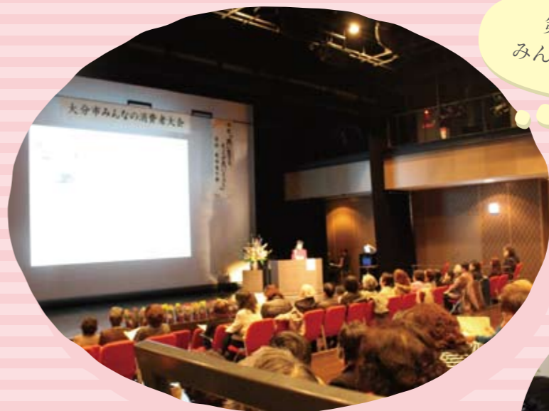
第39回大分市 みんなの消費者大会