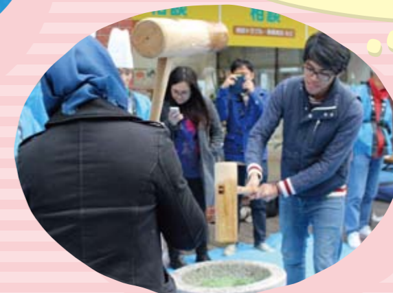
留学生交流 チャリティ餅つき大会