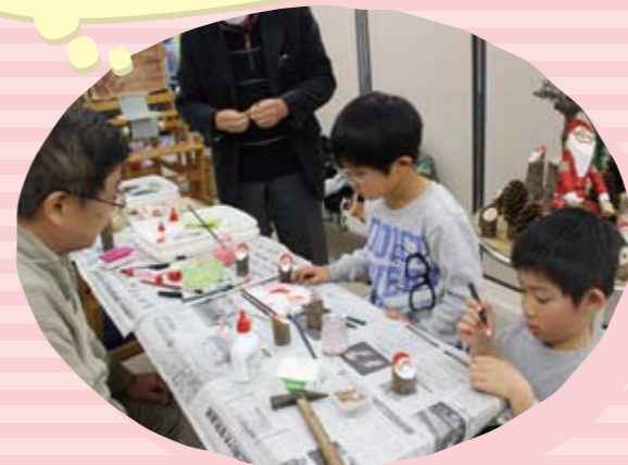
環境団体による クリスマスエコフェスタ