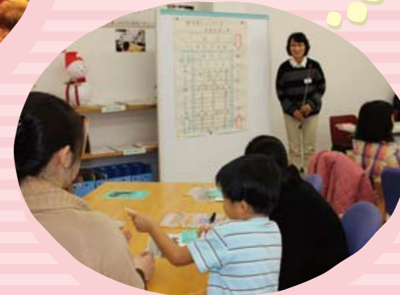
親子で学ぶ! おこづかい帳のつけ方教室