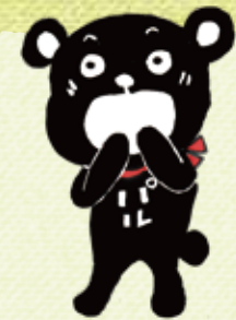
ライフパルのマスコットキャラクター バルくん