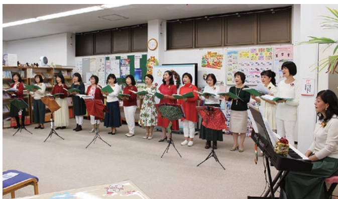
クリスマスコンサート（アンサンブルポラリス）