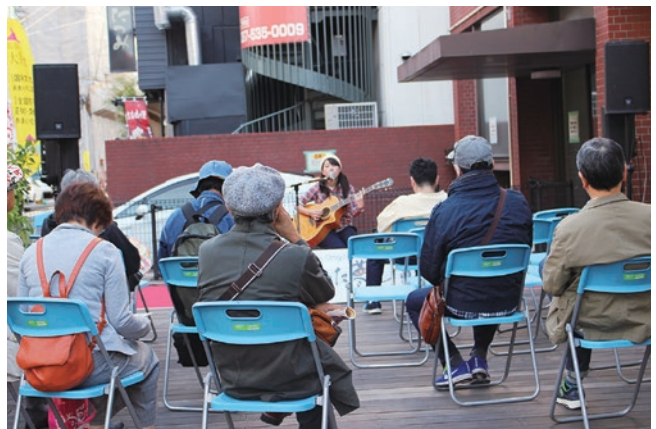
ウッドデッキでのイベントの様子

利用をお考えの場合、ライフパルのホームページに掲載の「ご利用にあたっての注意事項」及び「企画書の様式」を確認していただいた上で、お早目に一度ご相談ください。