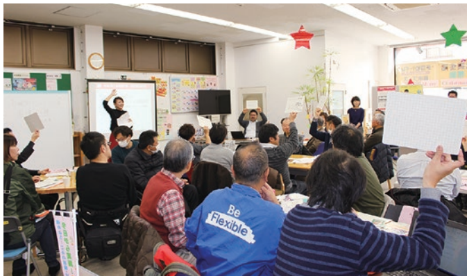
非営利組織のための第三者組織評価「グッドガバナンス認証制度」 説明会（特定非営利活動法人地域ひとネット等主催）