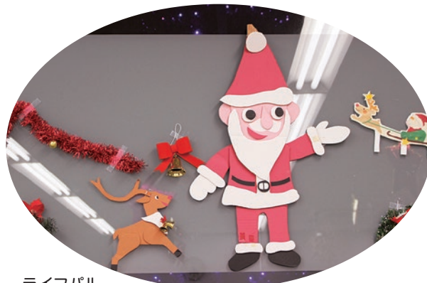
ライフパル クリスマス飾り付け