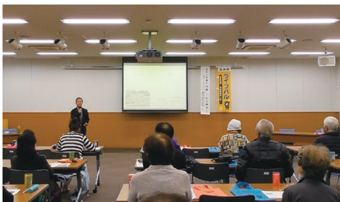
消費生活セミナー「お墓の問題、これで解決！」