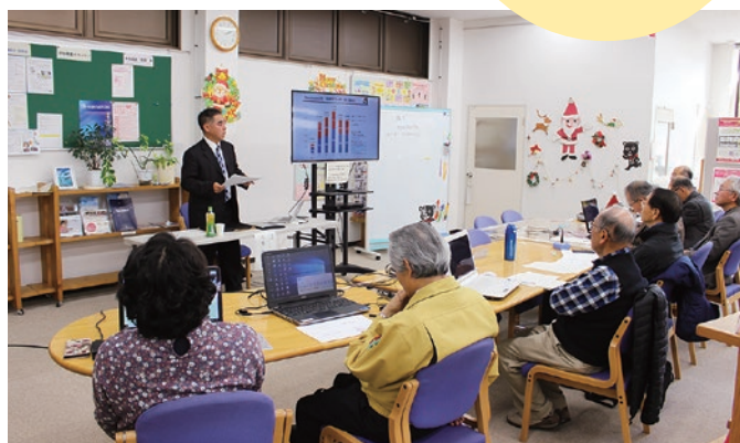
NPO運営基盤強化講座「私たちの思いを伝える広報」