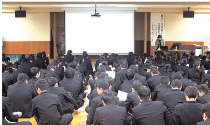
高校生のための消費者教育の啓発講座（楊志館高校）