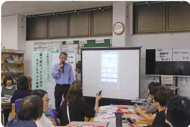
(買う前に!シニア向けスマートフォン体験講座)