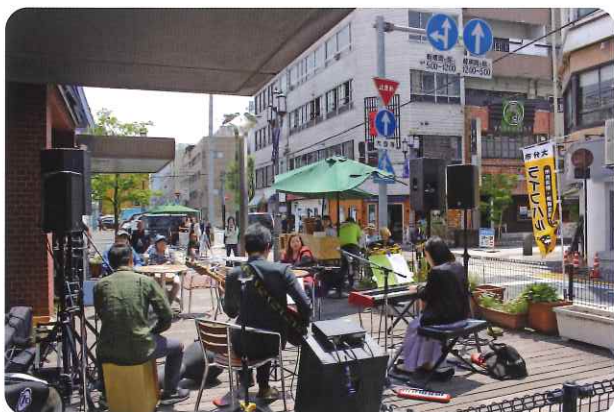
FUNA Iサウンドマーケット