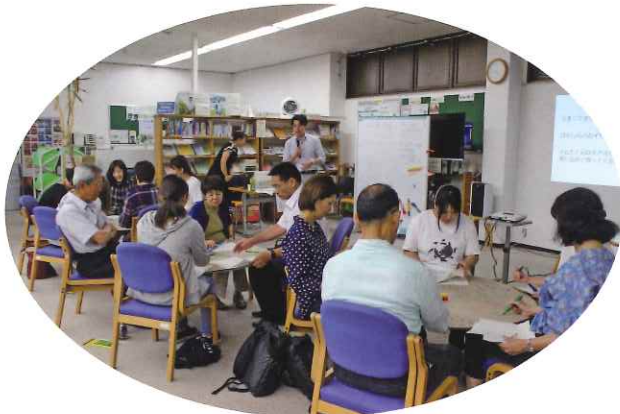
市民活動・NPO運営基盤強化講座 「スピーチ力を身につけよう!」