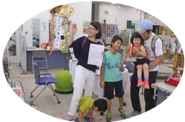
おもちゃ病院 おもちゃの修理5,000個達成!