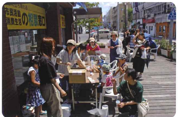
府内学生エコフェスタ