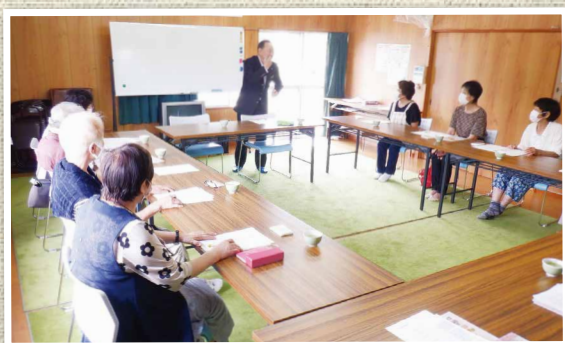
▲消費生活教室（中冬田寿サロン）