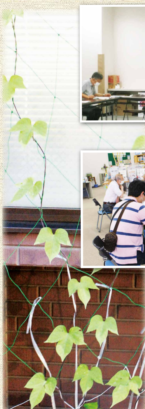
▲すくすく育つ朝顔