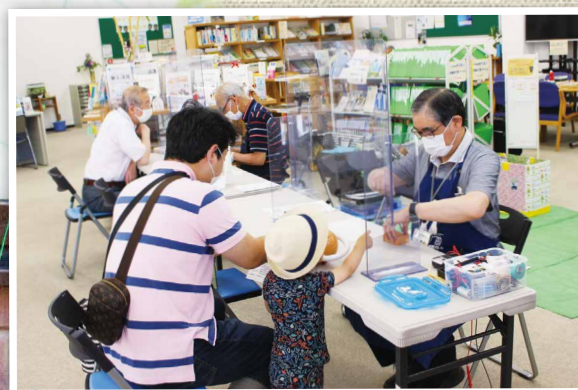
▲大分おもちゃ病院