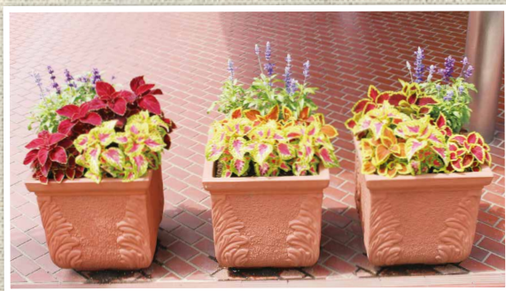
▲ライフパルの玄関です