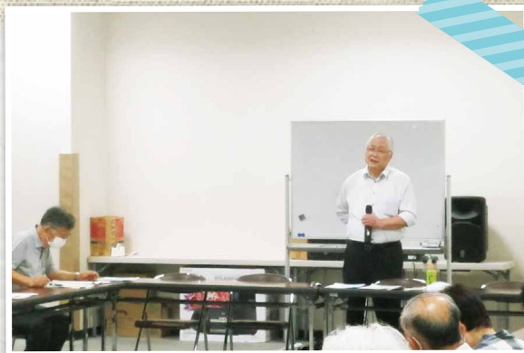
▲消費生活教室 (明野旭町老人クラブあさひ会)