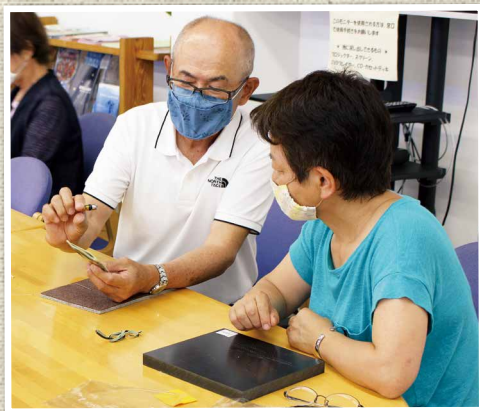
▲レザークラフト教室