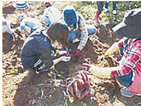
春に植え付けて秋に収穫、地域の保育園、幼稚園に贈呈しています。