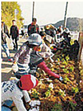
大分川ダム展望台周辺の美化活動と植栽・植樹活動

“オオイタ”と名前のつく生物で、私たちの生まれるずっと前からこの地に生息するオオイタサンショウウオをシンボルとしてマスコットにしました。名前は“PAL”よろしくね！