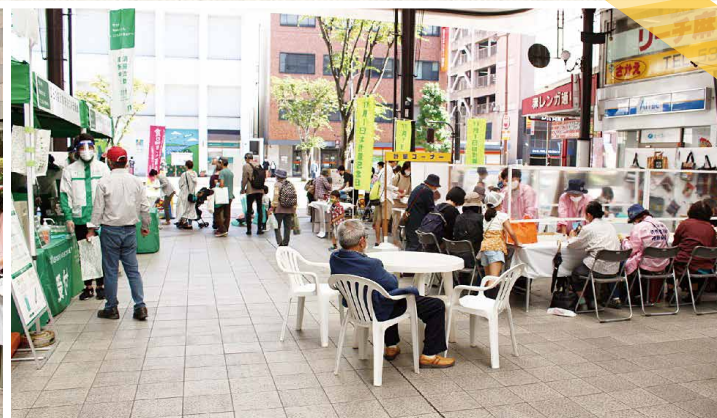
第43回 みんなの消費生活展