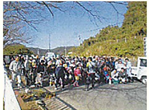
継続16年目、延5,715人が参加しています。