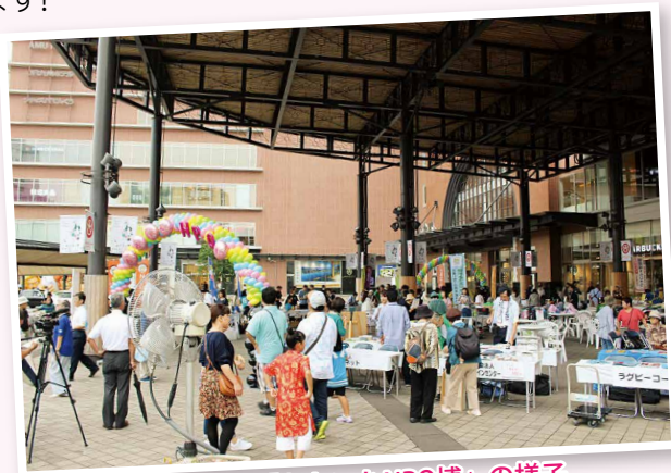
第3回「おおいたNPO博」の様子

※ご来場の際はマスクの着用をお願いします。また、会場への出入りは係員の指示に従ってください。 なお、新型コロナウイルス感染症の発生状況によっては、内容を変更したり、イベント自体を中止する可能性があります。