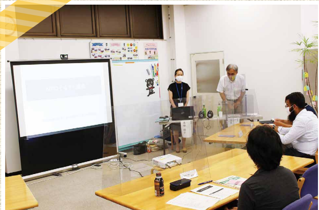
▲ 第1回 市民活動・NPO運営基盤強化講座