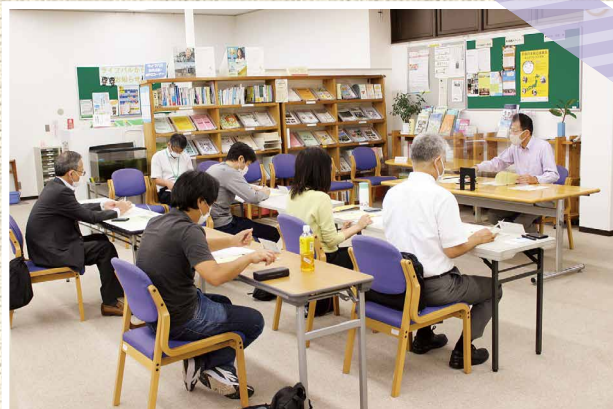
▲ 第2回 市民活動・NPO運営基盤強化講座