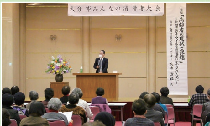
第44回「大分市みんなの消費者大会」