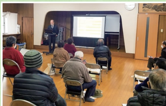
消費生活教室（森公民館）