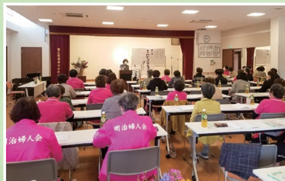
消費生活教室（明治公民館）