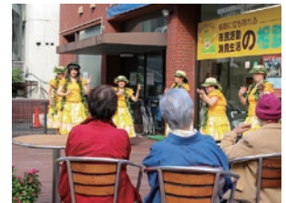
ウッドデッキでのイベントの様子

令和4年4月29日(金)～5月5日(木)のゴールデンウィーク期間中にウッドデッキを利用してイベントや活動の公開、アピールなどをされるボランティア団体、市民活動団体、NPO法人の募集をしています。