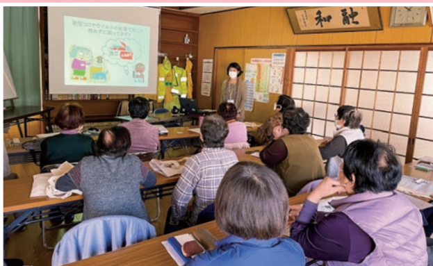
東浜1丁目ふれあいサロン 消費生活教室