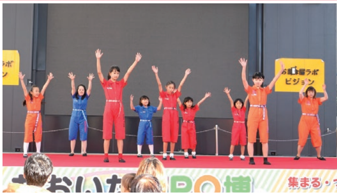
第5回「おおいたNPO博」(ステージ)