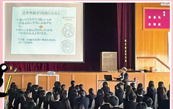
楊志館高等学校 消費生活教育講座