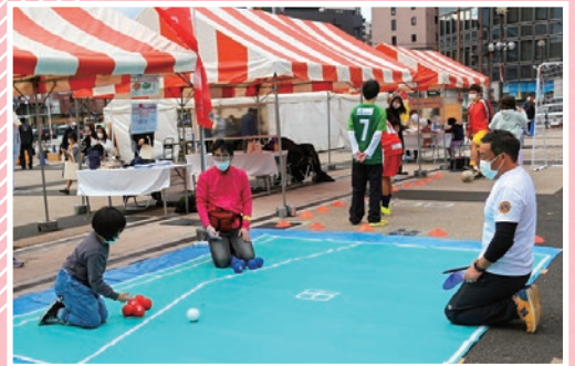
第5回「おおいたNPO博」(遊び広場)