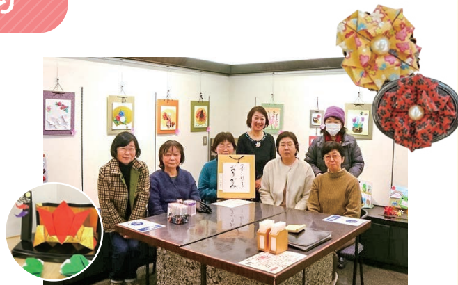
2021.1の折り紙展にて サークルメンバー