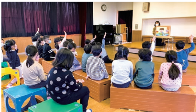
下郡保育所 消費生活教育啓発紙芝居