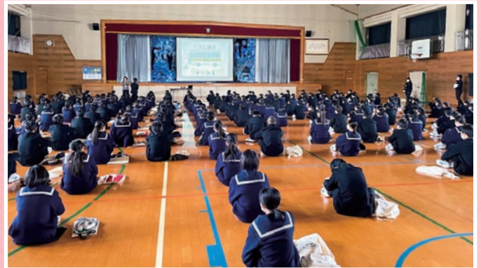
鶴崎中学校 消費生活教育講座