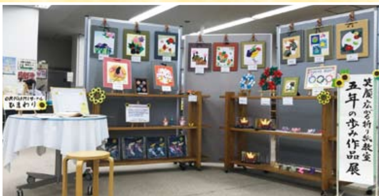
笑顔広がる折り紙教室 五年の歩み作品展