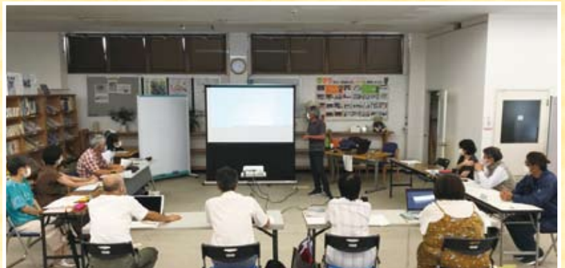
第2回市民活動・NPO運営基盤強化講座「SNSの効果的な使い方・発信の仕方」