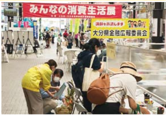
第45回 みんなの消費生活展