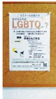
公民館玄関ガラス戸に貼って頂いたチラシ