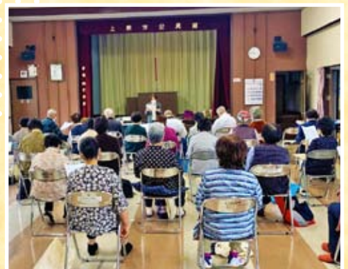
消費生活教室 (上宗方)