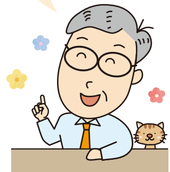
〇さん (相談員歴4年目・男性)