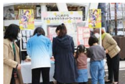
第5回NPO博のブース (好評だった消しゴムハンコ展示)

子どもたちが安心して学校生活を過ごせるように皆さまのご理解とご協力を賜れば幸いです。