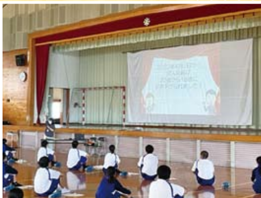
消費生活教育講座 (東陽中学校)