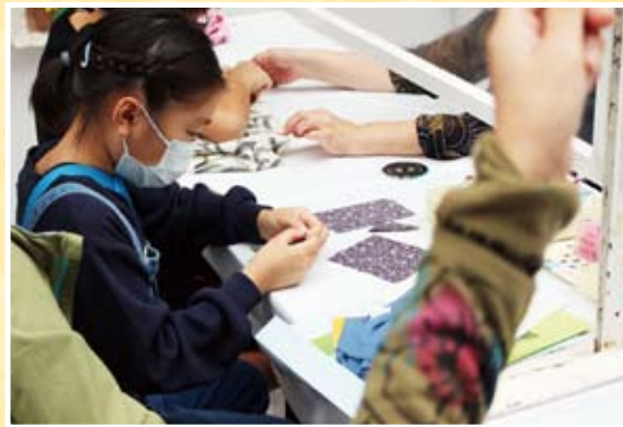
第45回 みんなの消費生活展(小物づくりコーナー)