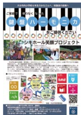
シキホール笑顔プロジェクト

連絡先 大分市古国府4-9-24 コーポふじの101 TEL&FAX 097-574-5258 mail oita.npodesign@gmail.com