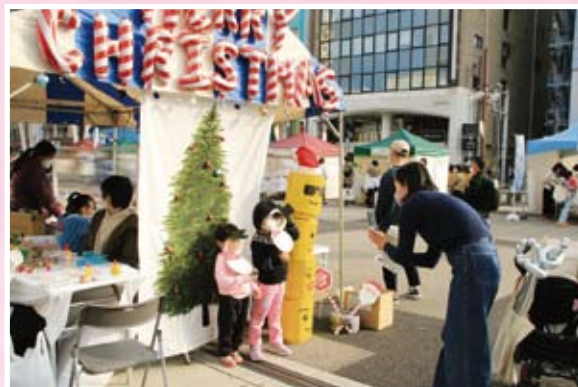
第6回「おおいたNPO博」(遊び広場コーナー)