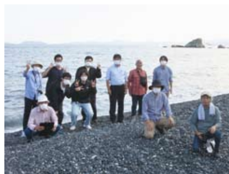
おおいたSDGsネットワークミーティング