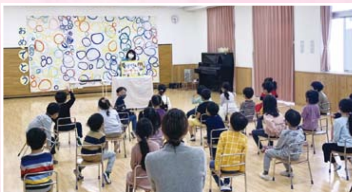
消費生活教育啓発紙芝居 (桜ヶ丘保育所)