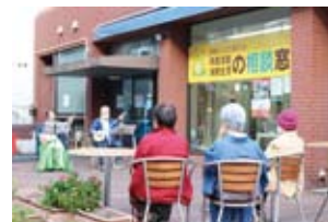
ウッドデッキでのイベントの様子

令和5年4月29日（土）～5月7日（日）のゴールデンウィーク期間中にウッドデッキを利用してイベントや活動の公開、アピールなどをされるボランティア団体、市民活動団体、NPO法人の募集をしています。