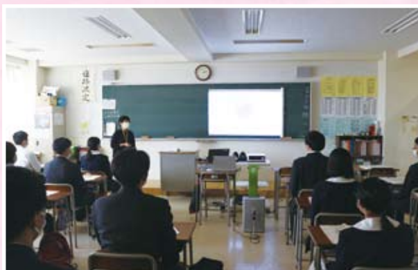
消費生活教室 (大分東明高校)