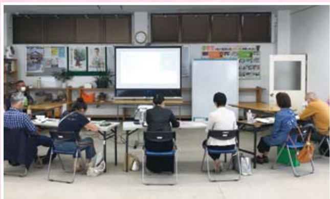
第4回市民活動・NPO運営基盤強化講座 「まちづくり活動の視点と運動の展開の仕方～アイデア・継続・共感～」