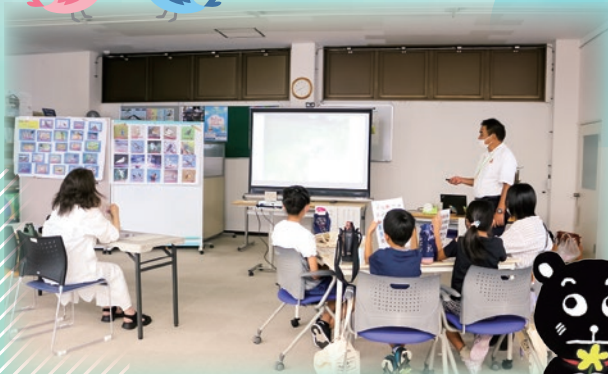
第1回大分市消費生活プセセミナー 「バードコールづくりと野鳥観察」