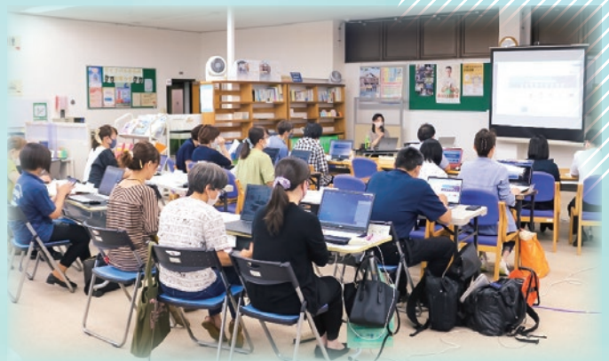
第2回市民活動・NPOサポート講座 「無料デザイン制作ソフトCANVAを使って 効果的なチラシ作成をする方法」