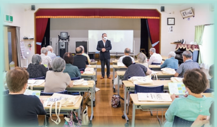
消費生活教室（皆春団地公民館）