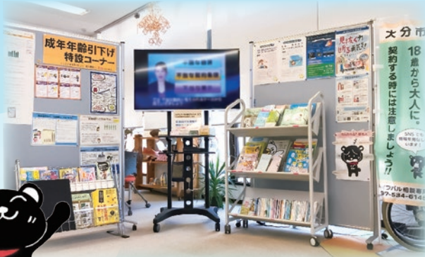
成年年齢引き下げコーナー