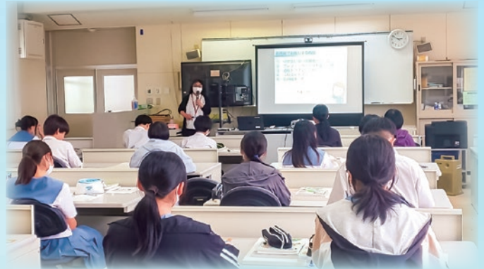
消費生活教育講座（野津原中学校）