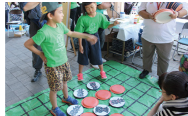
ふれあい囲碁ゲーム体験