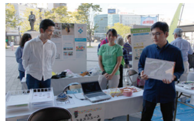
パネル展示、広報、ワークショップ

私たちは、就労継続支援B型という障がい者の就労訓練を行う事業をしています。その一環として手作りの小物やお菓子の製作、販売をしています。この機会に、より多くの人に障がい者の事を理解してもらいたいです。 [感想] 綿菓子が好評で、購入者の皆さんにも喜んでいただけました。