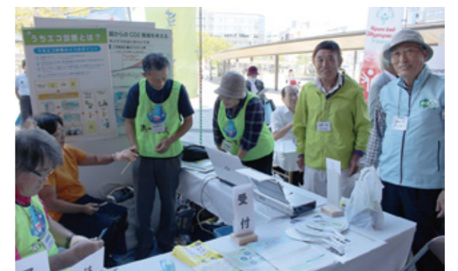
活動展示、うちエコ診断、竹箸製作販売

大分県内でユネスコの青年部として活動しています! イベントを通じてユネスコ活動を知ってもらえたらと思います。是非ブースにお立ち寄り下さい! [感想] 参加団体の種別が多様だったため、いろいろ見応えがあった。